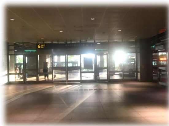
> 台中烏日高鐵站 1 樓 6 號出口旁空地

7/21(二)09:00~09:20 ·請於集合時間內抵達不要遲到·另外集合處會有工作人員舉著「未來能源·我作主」2天1夜夏令營活動之手舉牌引導學員完成報到手續·如不知如何到達集合處·請致電現場聯絡人徐先生:0921-845-055